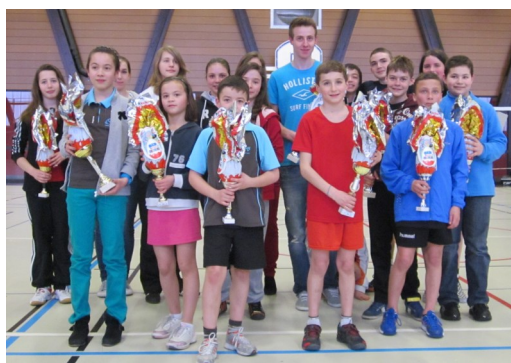
Le podium du TDJ de Miribel

Le classement provisoire s'établit ainsi :