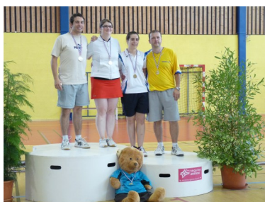
Le podium Mixte D 2011

http://ain-badminton.jimdo.com/championnat-de-l-ain/