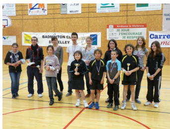
Le podium du TDJ de Belley

Après 6 Tournois Départementaux Jeunes, voici les classements.