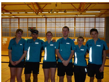
L'équipe Championne Départementale

Du côté des équipes de l'Ain engagées en Régionale et Nationale :